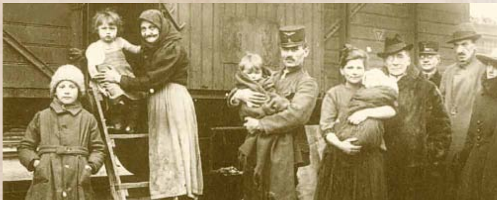
Trianoni menekültek a húszas években (Internet)