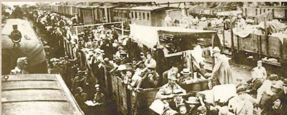
Menekülők vonata Brassóban 1916-ban