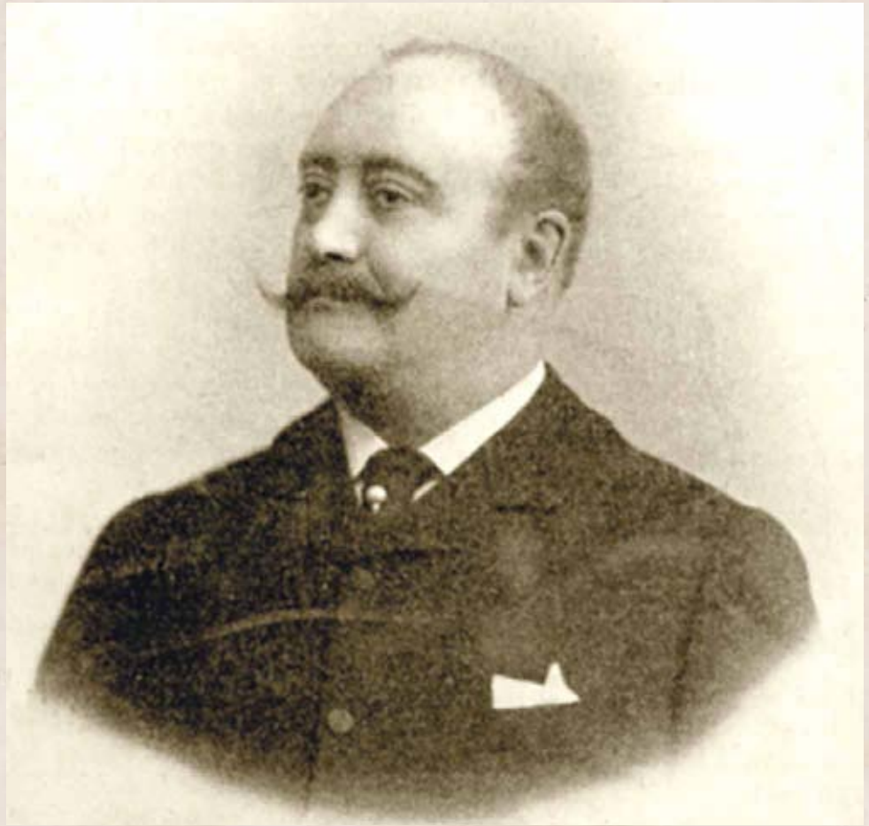
Kossuth Ferenc függetlenségi pártvezető

„(A szeretett képviselőjelölt.) Krasznay Ferenc, a dunapataji kerület Kossuth-párti képviselő-jelöltje leginkább elmondhatja magáról, hogy ő «szeretett jelölt». Ezt bizonyára annak köszönheti, hogy meg nem szünően ápolja a szeretetet a maga és pártjabeliek között. Már hónapok óta körutakat, bevonulásokat, kivonulásokat, bankettek rendez a Kerületben, hol magánosan, hol Kossuth Ferencel, hol pártjának kiváló tagjaival. Egy darabig azonban kétséges volt, hogy Krasznay