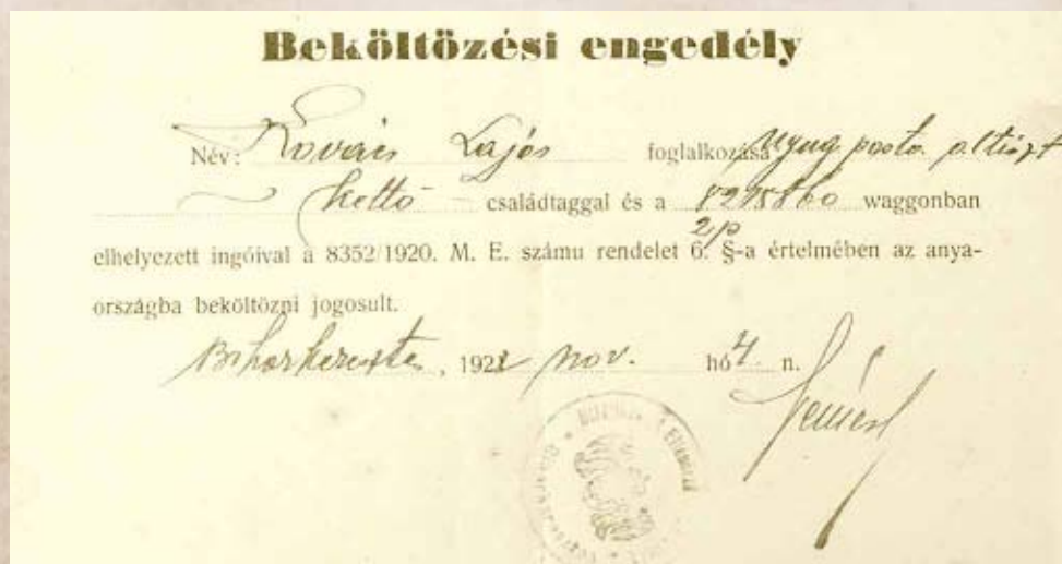
Beköltözési engedély 1922-ből