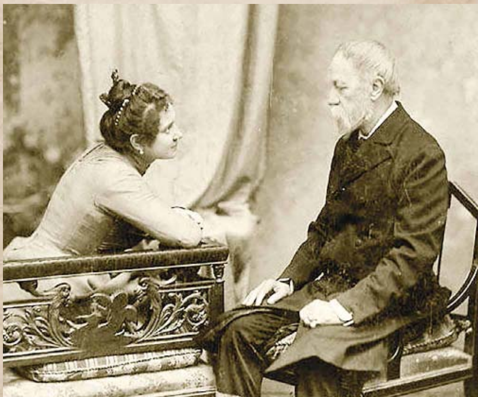
Jókai Mór második feleségével, Nagy Bellával

Ekkor újabb nyílt levél jelent meg a lap címlapján, immár aláírás nélkül, az „elszigetelt kiskőrösi tót magyarok” nevében. Ez utóbbi már markánsan különbözött a fent hivatkozott társától. A csalódottság mellett egyértelműen a sértettség és a gúny dominált benne, sőt, még a személyeskedés is