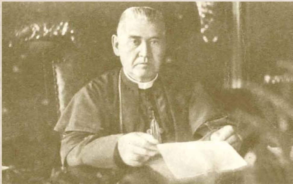
Vass József kultuszminiszter (Internet)

terén, már a centenáriumi programokhoz kapcsolódva, egy ún. Petőfi matinét fognak tartani a Szarvas fogadó színháztermében, budapesti művészek közreműködésével, s ennek az estnek a bevételét szintén a szobor-alap növelésére fordították volna. Azonban az utolsó pillanatban történt valami, ami miatt a rendezvény jellege módosult. Bár sor került végül egy Petőfi estélyre a Kiskőrösi Football Club rendezésében, azonban ért-