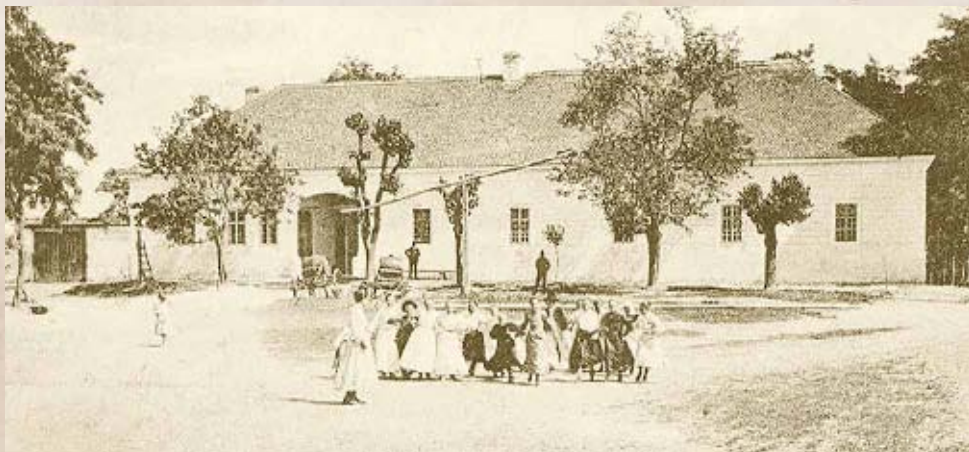
A dunapataji községháza (Internet)

Az 1896-os választások óta nem csitult az ellentét Kossuth Ferenc és Ugron Gábor hívei között. Ahol lehet, elindultak egymással szemben. Mindkét fél magát tartotta a függetlenségi eszme igazabb hívének, és a másikat gyanúsította a kormányval való összejátszással. Tulajdonképpen a két szembenálló államférfi megegyezett abban, hogy szembehelyezkedtek a szélsőségesen függetlenséggel, mindketten arra törekedtek, hogy kormányképes erőt kovácsoljanak a pártból. Igazán markáns különbség két kérdésben volt közöttük. Kossuth és hívei annak ellenére támogatták liberális szemléletű egyházpolitikai reformokat (polgári házasság, polgári anyakönyvezés, zsidó vallás recepciója), hogy ezt a szabadelvű kormány ter-