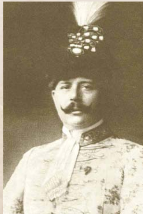
Pekár Gyula államtitkár (Internet)

jóval később jutott el az országos hírlapokhoz. Személyes kapcsolatfelvétel, megszólítás az illetékes szervekkel nem történt, erre utal a helybeli újságíró megállapítása is újév napján: „[...] úgy tudjuk, az intézőbizottság a közeli napokban küldöttséget meneszt Budapestre megzörgetni minden ajtót.” 16 Ezeket