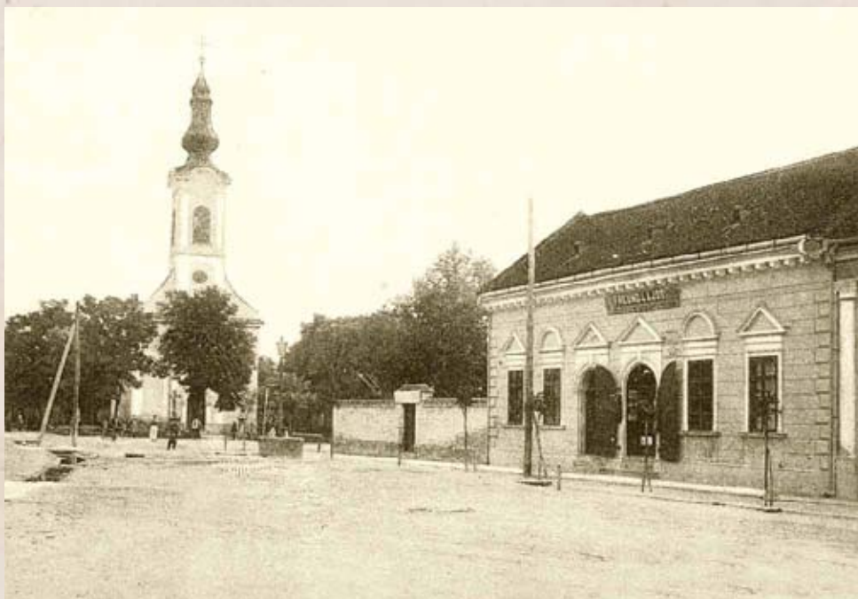
Dunapataj látképe a XX. század elején

A dunapataji kerület eleinte valóban ellenzékiinek számított. Sőt 1869-ben az akkor még balközép párti, tehát ellenzéki Ivánka Imrét 4 legyőzte a szélsőbal jelöltje, Kossuth egykori titkára, Rákóczy János. 5 Tragikus öngyilkosságáig Vidats János 6 egykori márciusi ifjú is a szélsőbal (Országos 48-as Párt) képviselte Dunapatajon. A kormányoldal, ekkor már a Szabadelvű Párt először csak 1875-ben tudta elhódítani a kerületet, de képviselője, Kovácsy Gyula 7 a következő választásokon veszített a függetlenségi jelölttel szemben. 1881-ben következett be a legérdekesebb fordulat. A kerület korábbi ellenzéki