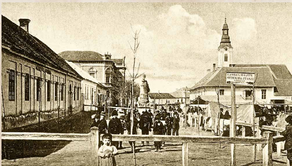
Piac a főtéren a századforduló környékén

A kapitalizálódó Magyarország, a népesség gyors növekedése, a feudális és félf feudális struktúrák megléte, vagy az alacsony munkabérek nem csupán az ekkoriban születő ipari munkásság körében teremtettek feszültségeket, amelyek aztán valós társadalmi törésvonalá válnak, hanem a hagyományos