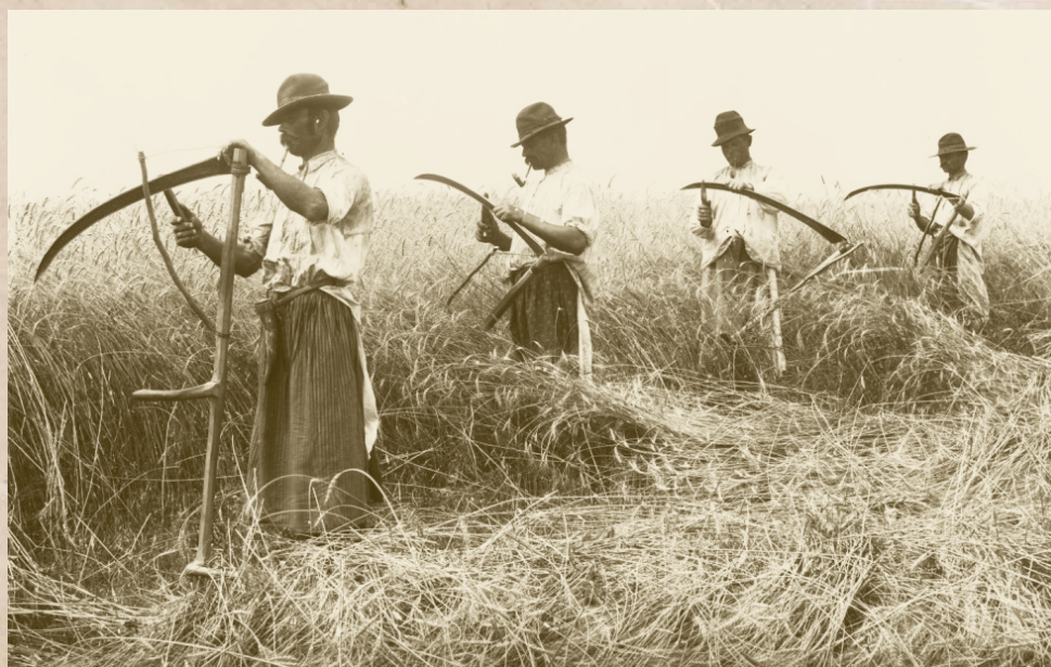
Aratómunkások 1900 körül (Illusztráció, Internet)

Ha a település modern kori történetét nézzük, akkor elmondhatjuk, hogy politikai érdekképviselet tekintetében a századfordu-