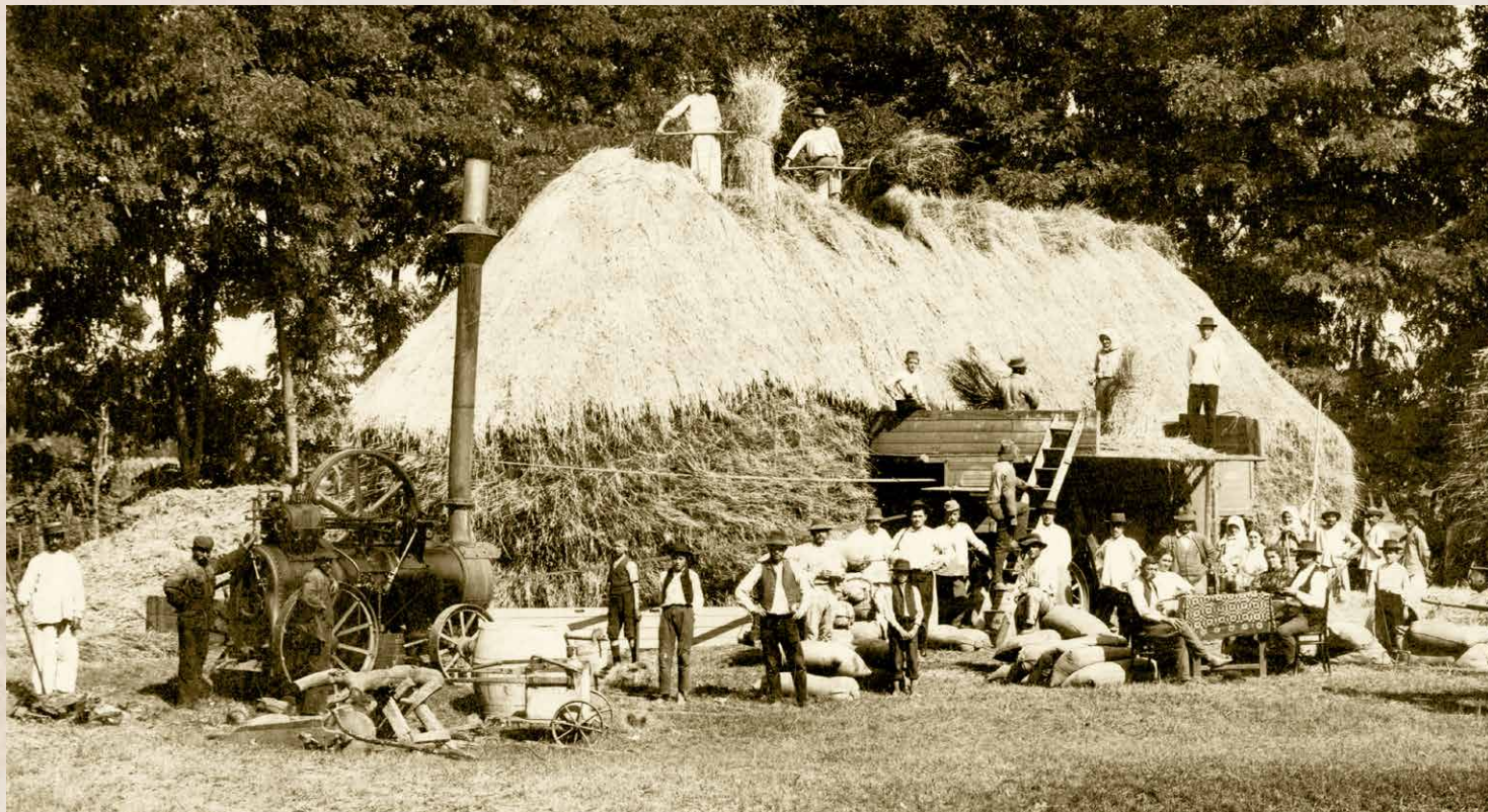
Gépi cséplés Kiskőrösön az 1910-es években (PSVK HGY)

ló környékén előbb a Függetlenségi és 48-as Párt, majd az első világháborút követően a kiscgazda programmal fellépő pártok jelöltjei arattak sikereket. Klasszikus baloldali, tehát szocialista, szociáldemokrata eszmék jelentős tömegbázisra sohasem tudtak Kiskőrösön szert tenni, ez azonban nem jelenti azt, hogy ne lettek volna jelen, ne lett volna hatásuk a helyi közösség életére, s ez különösen igaz néhány 'forró pontra', úgymint az 1897-es agrárszocialista zavargásra, az 1905-ös választásokra, az 1918-1919-es forradalmakra, vagy az 1929-33-as világválság időszakára. Sőt, tulajdonképpen az MSZDP helyi szervezete is az agrármozgalmakból nőtte ki magát, nem véletlen, hogy vezetői között is leginkább parasztembereket találunk. Itt pedig visszakanyarodunk eredeti témánkhoz, a klasszikus baloldali eszmék kiskőrösi kezdeteihez.