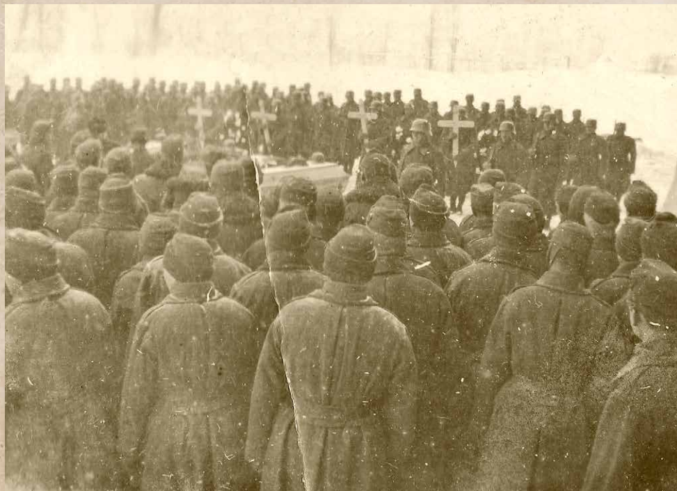
Honvédek temetése a keleti fronton