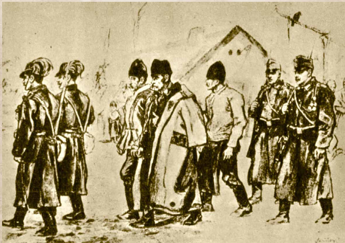
„Szocialista zavargókat” kísérik a csendőrök 1898-ban (Illusztráció, Internet)

Az elővigyázatosság ugyan nem volt alaptalan, ám a hatóság ez alkalommal semmit sem bízott a véletlenre, és a fegyveres erőszak mellett döntött. Ahogyan a Halas és Kis-Kőrös megírta: „A csendőrök, szám szerint harmincan, egy hadnagy vezetésével meg is érkeztek. Vasárnap reggel 4 órakor felvonultak a városházához. Egy részük szuronyosan a városháza előtt foglalt állást, míg a nagy rész (ezek között volt a tizenkét lovas is) a község-háza udvarán ütött tanyát. –