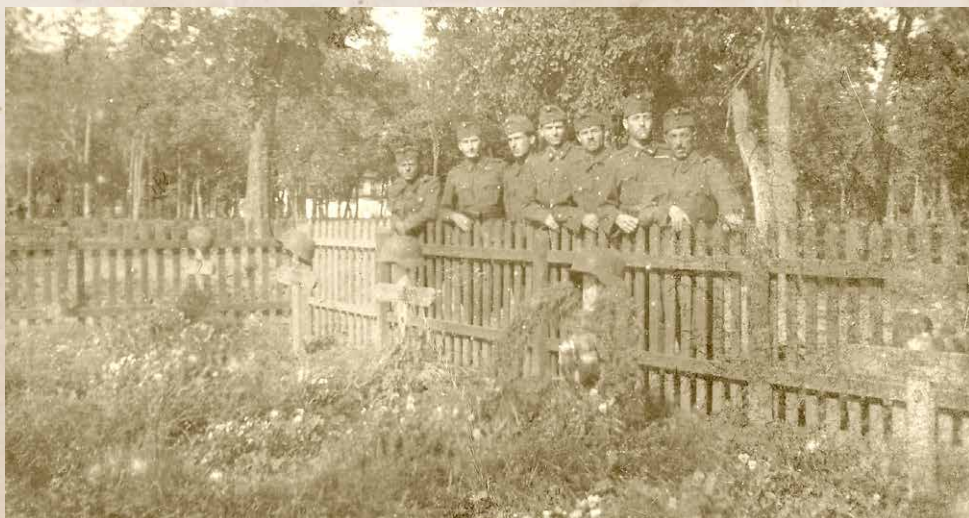
Bajtársak sírjánál